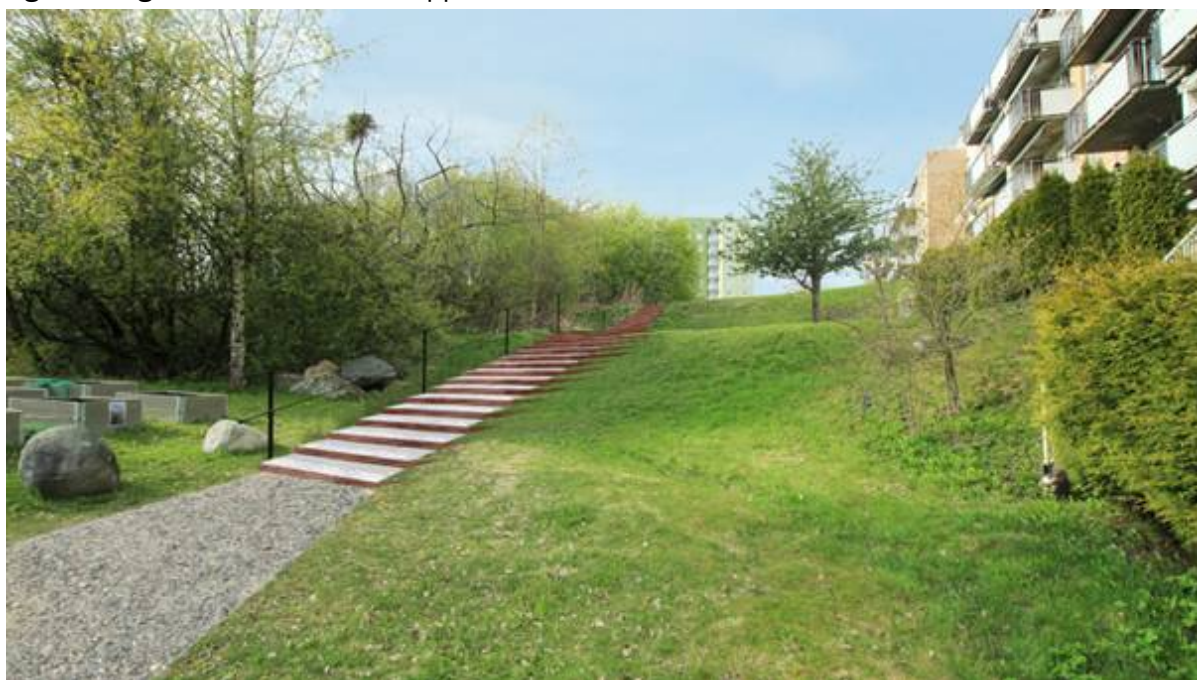
Fig.1 Forlag til forbindelse via trapper

Området har tre skarpe høydeforskjeller som krever at det må anlegges to lange trapper. Se fig.1.